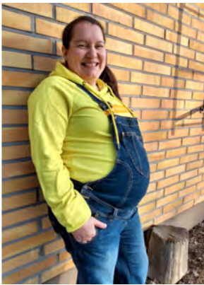
Rv 21, eli puolet raskausviikoista nyt takana. Kylläpä viikot kuluvat nopeasti.