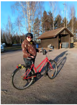
Vihdoin pääsee taas pyöräilemään.