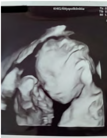
Uuden perheenjäsenen tuorein kasvokuva rakenneultrassa.

Usean peruutuksen jälkeen pääsimme viimein käymään myös rakenneultrassa. Yllätyimme kuinka monenlaisia asioita kättilö pystyi tarkistamaan sen kuvan kautta. Ultran perusteella kaikki näyttää etenevän normaalisti. Kättilö oli sitä mieltä, että vauva saattaisi olla poika. Jännittävää!