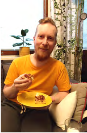
Mikon itse leipomaa omenapiirakkaa.